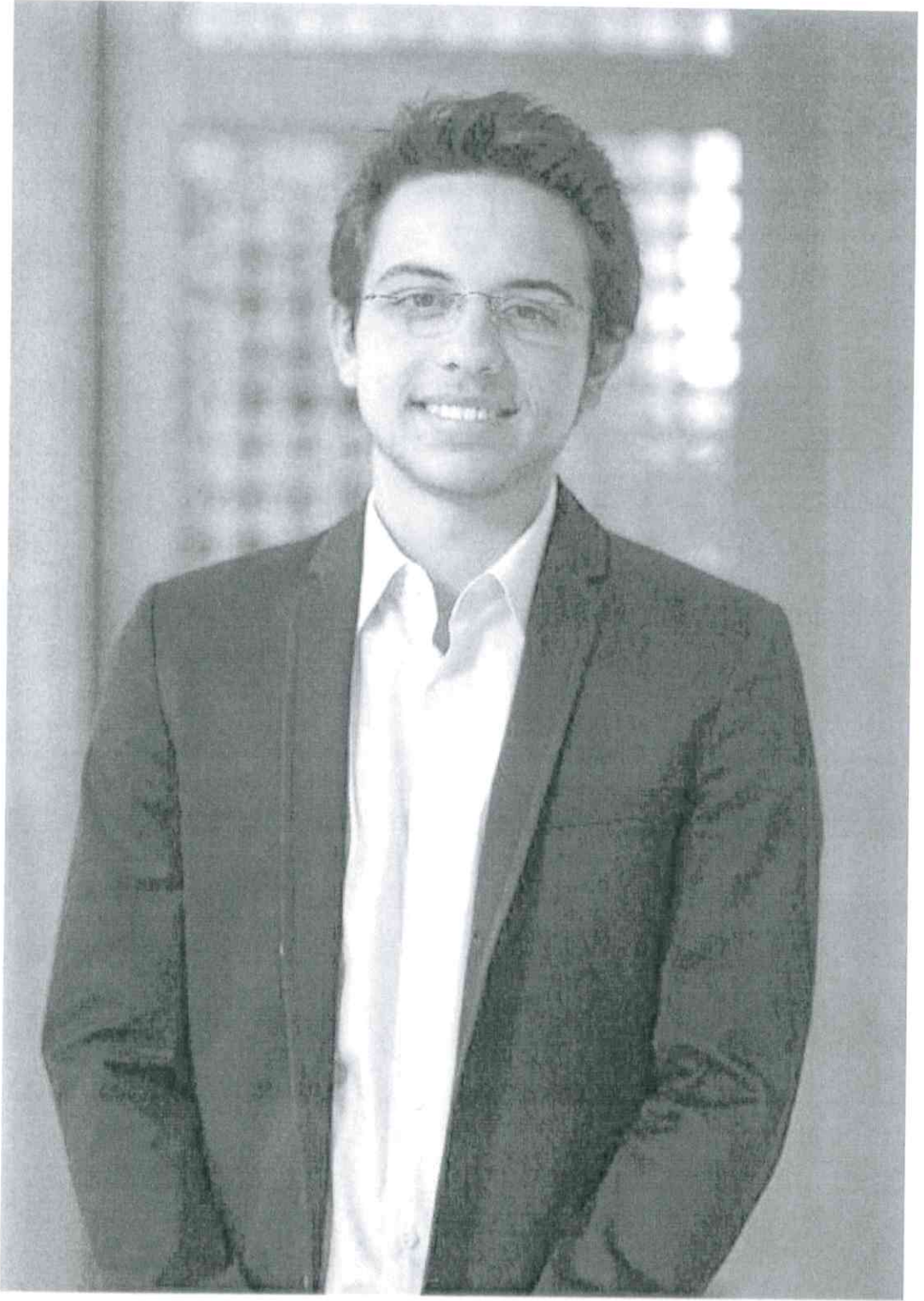
حضرة صاحب السمو الملكي الأمير حسين بن عبد الله الثاني المعظم