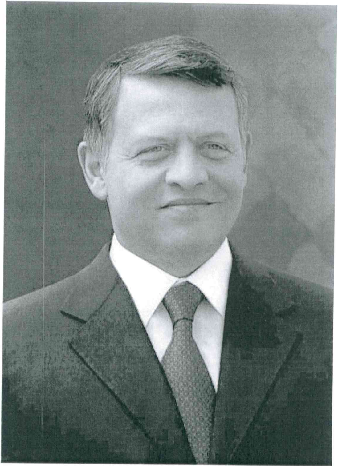
حضرة صاحب الجلالة الملك عبدالله الثاني بن الحسين المعظم